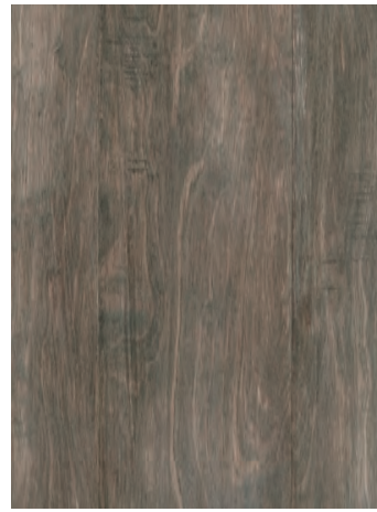
7056 BAYSIDE BIRCH / MERISIER BAYSIDE