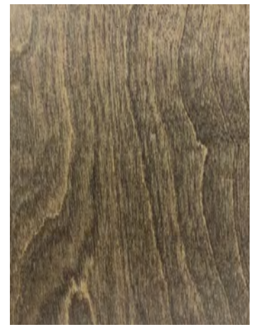
7107 BUCKWHEAT BIRCH / MERISIER SARRASIN