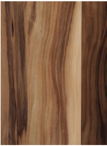
7054 SPICE ACACIA / ACACIA ÉPICE