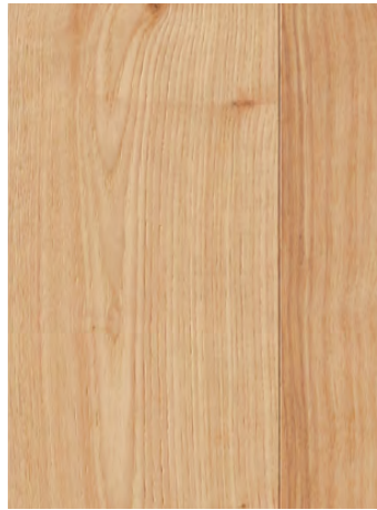
7120 MACMILLAN HICKORY / HICKORY MACMILLAN