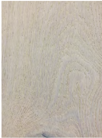
7119 COAL HARBOR OAK / CHÊNE COAL HARBOR