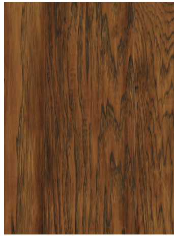
7055 AUTUMN HICKORY / HICKORY AUTOMNE