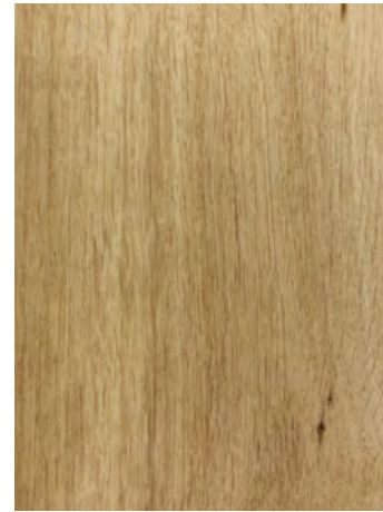
7126 VICTORIA OAK / CHÊNE VICTORIA